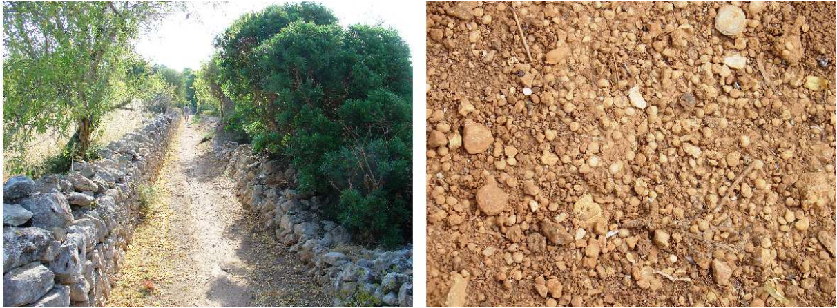
Fig. 2. Camí i costa de ses Llènties (Alqueria Blanca, Santanyí), paleontotoponim motivat per l'abundància de nummulits (Eocè), als que a Mallorca s'aplica la denominació popular de "llèntia", per la forma rodona i més o menys lenticular, i petita mida, que fa que semblin autèntiques llènties petrificades.

Ubicació: Sant Josep de sa Talaia (Eivissa) (UTM 31 S 346531 4312709 – 0 m) Descripció: Platja Motivació: Abundància d'Orbitolinids (Cretaci inf.). Vegeu epígraf 1.6, del que és derivat Font/s: EEIF, 1995-2006