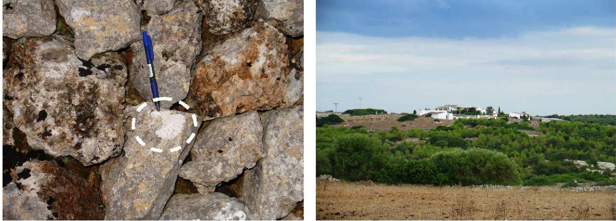
Fig. 3. Torrepetxina, llogaret de Ciutadella de Menorca, on l'abundància de pectínids miocens a les pedres de les parets a motivat aquest paleontotopònim.

UTM 31 S 581332 4425077 Descripció: Cases de lloc menorquí Motivació: Pectínids (Miocè). Vegeu epígraf 1.13 Font/s: Dades pròpies inèdites JQC